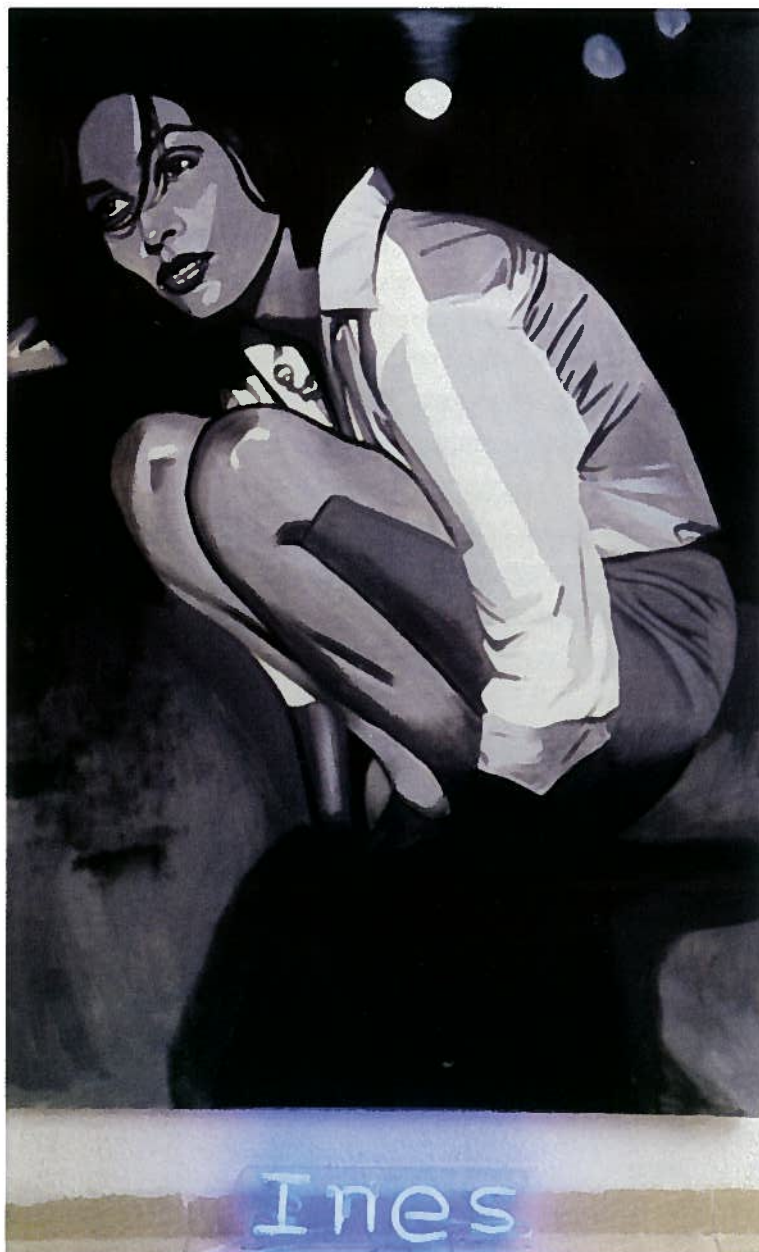
Inés - neón, 2000 Acrílico sobre tela, neón 195 x 130 cm.