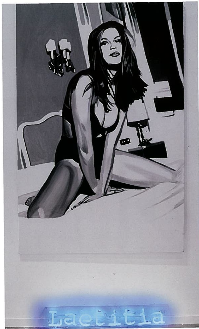
Laetitia - neón, 2000 Acrílico sobre tela, neón 195 x 130 cm.